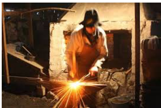
Smed i arbete

På bruket verkar tre smeder som tillverkar konstsmide vilket säljs i konstsmidesbutiken.