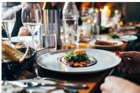
Wira Bruk är också välkänt för mat, kaffe och goda bakverk...